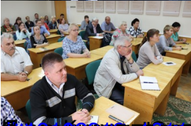
Профактив области обсудил инициативу Д.А. Медведева о сокращении рабочей недели, которая п